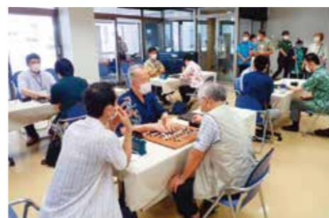
2022年浦添市、対局風景