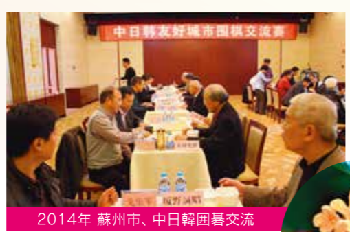
2014年 蘇州市、中日韓囲碁交流