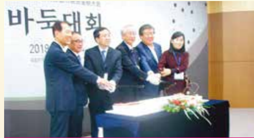
2018年 全州市、韓中日囲碁交流