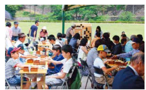
2016年金沢市しいのき迎賓館広場、フリー対局、奥は入門教室