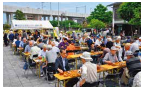
2015年 松任駅前広場 あおぞらフェスタ、フリー対局