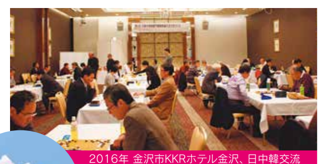
2016年 金沢市KKRホテル金沢、日中韓交流