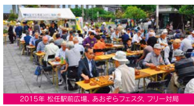
2015年 松任駅前広場、あおぞらフェスタ、フリー対局