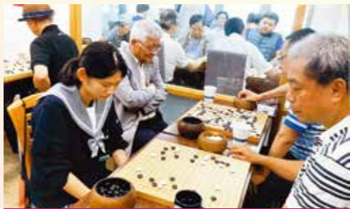
2018年 中華台北市棋聖模範棋院、囲碁交流