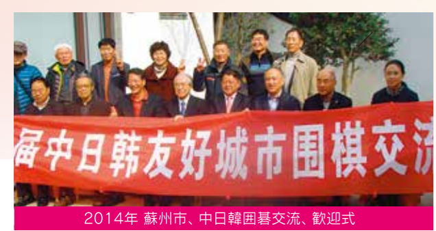
2014年 蘇州市、中日韓囲碁交流、歓迎式

1回戦、2回戦 (10:30～14:30) 参加料/大人2,000円、高校生以下1,000円 1チーム5人、アジア6チーム(蘇州市、全州市、中華台北市・中華台南市) 日本18チーム(申し込み順で選定)、 合計24チームによる競技、(持ち時間:45分) 終了後、観光またはフリー対局に参加可