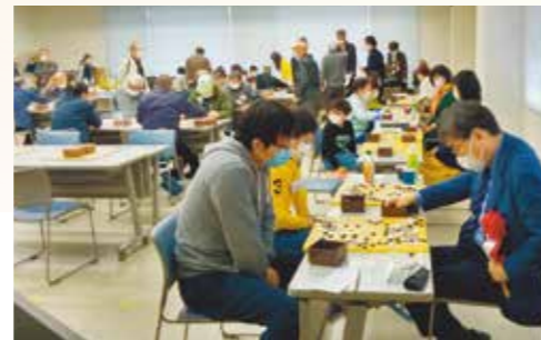
2022年 金沢市、歴史を学ぶ囲碁フェスタ 指導碁 (石倉 昇九段)、フリー碁