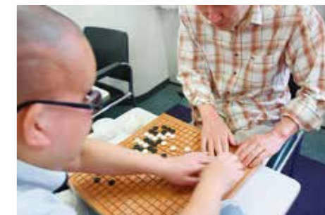
アイゴ盤による対局