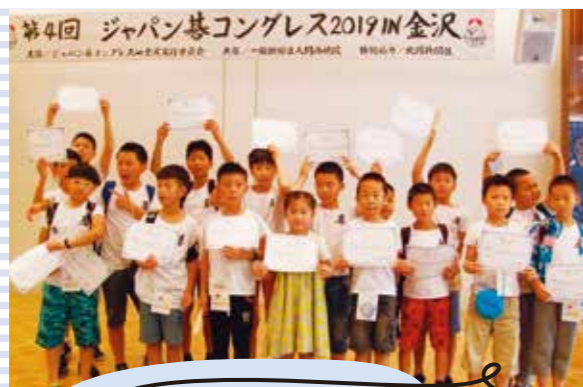
第4回ジャパン碁コンgres2019in金沢 表彰式（世界の子ども達集合）