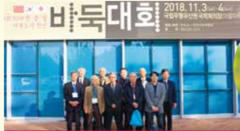
2018年 全州市囲碁交流、金沢市メンバー