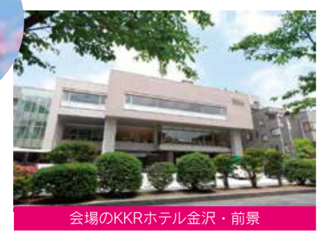
会場のKKRホテル金沢・前景