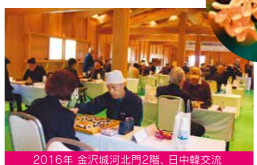
2016年 金沢城河北門2階、日中韓交流